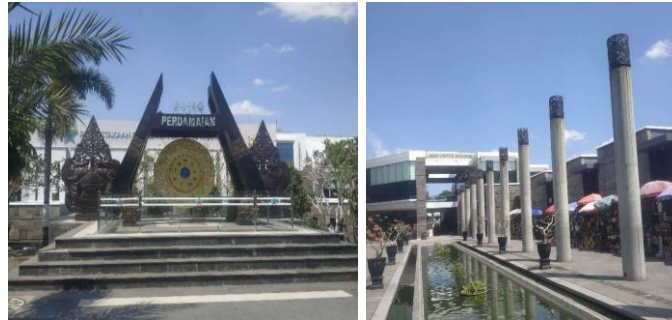
Gambar 2. Gong Perdamaian, Pilar-Pilar Museum (Sumber, Penulis, 2025)

perdamaian dari Bung Karno. Gong Perdamaian ini merupakan bentuk perjuangan Bung Karno cinta damai dengan gerakan Non-Blok dalam posisi global.