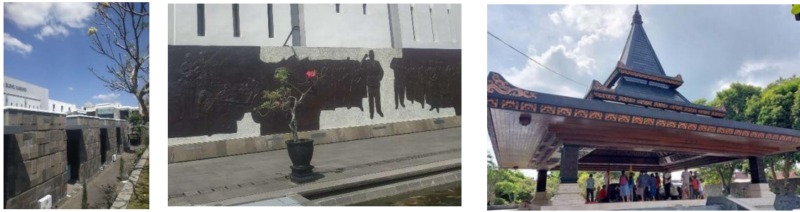
Gambar 4. Finishing Material Batu Andesit, Relief Di Dinding, Ukiran Jawa Dan Material Kayu pada Atap Pendopo Makam

Ukiran dan nuansa jawa sangat kental di pendopo makam Bung Karno, menunjukkan latar belakang budaya dari tokoh proklamator. Pengunjung awam dapat menerka latar belakang Bung karno tanpa harus membaca petunjuk terlebih dahulu. Selain itu beberapa pilihan finishing berasal dari material bata merah yang memberikan nuansa tradisional.