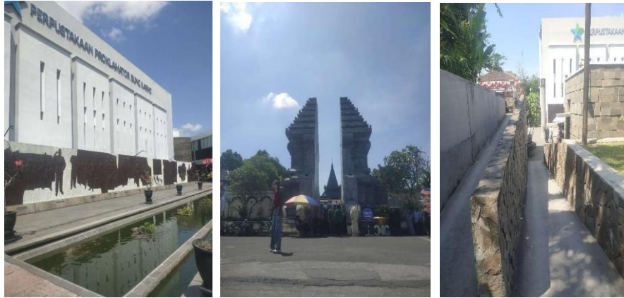
Gambar 3. Ruang Terbuka Sekaligus Jalur Sirkulasi Utama, Gapura Masuk Area Makam, Akses Ramp Masuk Area Makam