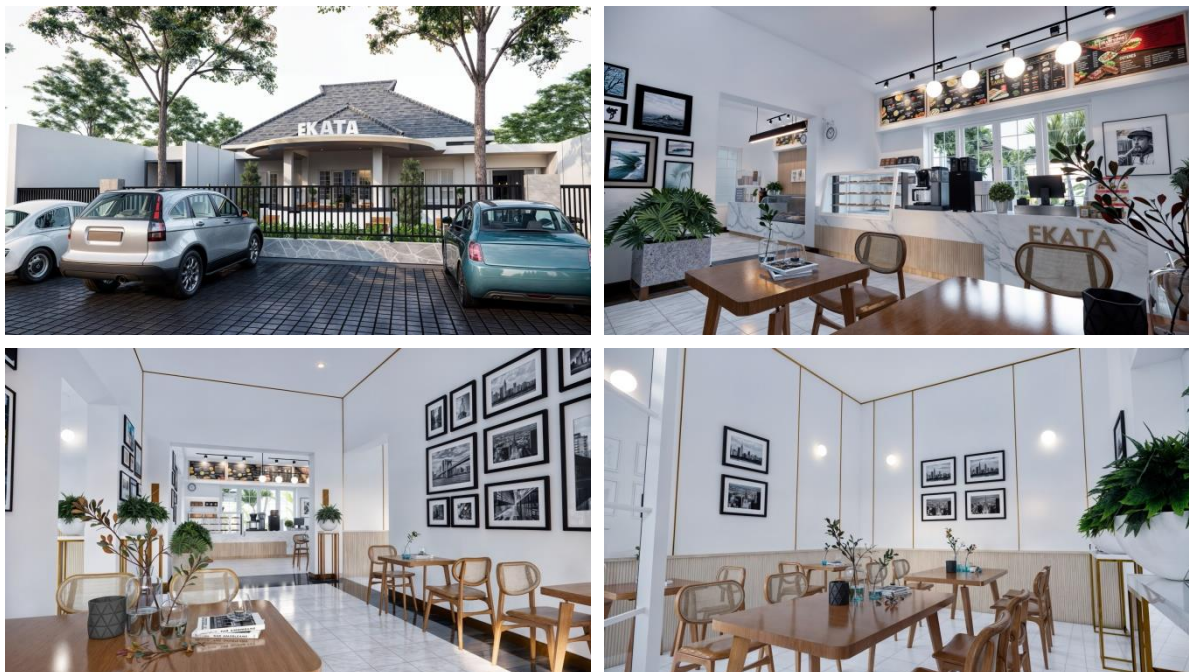
Gambar 5. Perencanaan Interior Ekata Cafe

Dalam tabel 3 juga menunjukkan bahwa elemen arsitektur kolonial ternyata masih dipertahankan sebagai identitas visual utama bangunan. Elemen yang paling banyak dipertahankan yakni plafon tinggi, jendela besar, pintu kayu, lantai tegel lama, dan struktur utama bangunan. Sementara itu, perubahan dominan terjadi pada elemen interior seperti furniture, pencahayaan buatan, instalasi utilitas, dan penambahan partisi ruang untuk kebutuhan operasional kafe.