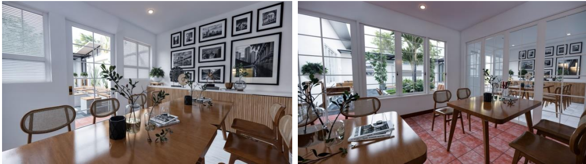
Gambar 6. Perencanaan Interior Area Private Room Ekata Café (Sumber : Koleksi pribadi, 2024)