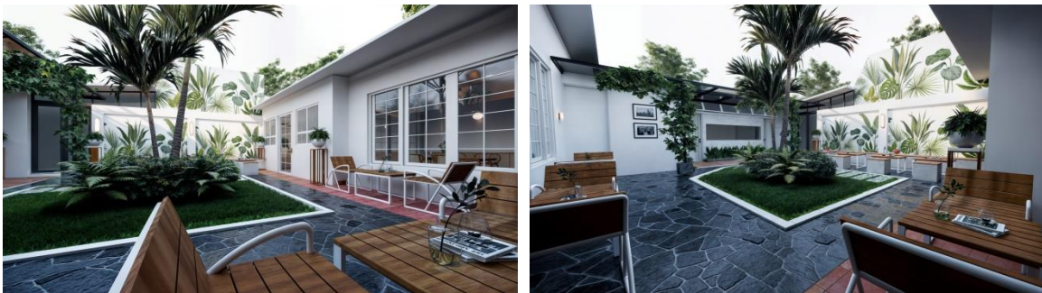
Gambar 7. Perencanaan Interior Area Outdoor Ekata Cafe