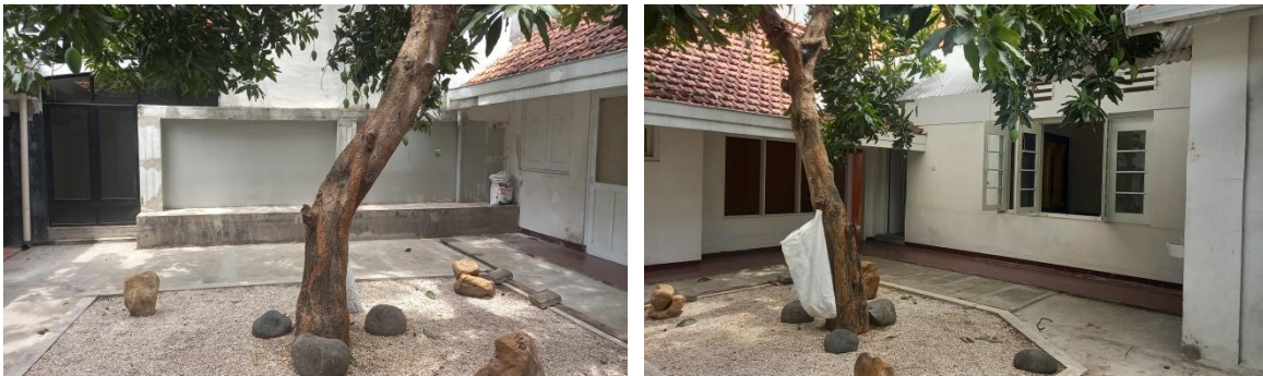
Gambar 3. Kondisi Eksisting Bangunan Bagian Taman Belakang

Secara spasial, perubahan fungsi rumah tinggal menjadi kafe menyebabkan transformasi tata ruang dari pola privat menuju ruang publik yang lebih terbuka dan fleksibel. Ruang tamu biasanya diadaptasi menjadi area makan utama, kamar tidur menjadi seating area, sedangkan halaman belakang dimanfaatkan sebagai outdoor café. Adaptive reuse adalah strategi arsitektur yang bertujuan mempertahankan bangunan lama dengan fungsi yang diperbarui agar tetap relevan di era modern (Kurniawan & Seprianto, 2025). Menurut L. Wong (2024) mengemukakan dalam teori transformasi ruang interior, perubahan fungsi bangunan akan memengaruhi zoning ruang, pola sirkulasi, dan hubungan antar ruang sesuai kebutuhan aktivitas baru pengguna. Penyesuaian tersebut dilakukan tanpa mengubah struktur utama bangunan agar identitas kolonial tetap terjaga (Insan et al., 2024). Dalam praktik adaptive reuse , elemen interior modern seperti pencahayaan tambahan, furniture, dan utilitas akan ditambahkan untuk mendukung kebutuhan operasional fungsional ruangan yang baru, sementara elemen kolonial seperti pintu kayu, lantai tegel lama, dan struktur dinding tetap dipertahankan sebagai identitas visual bangunan.