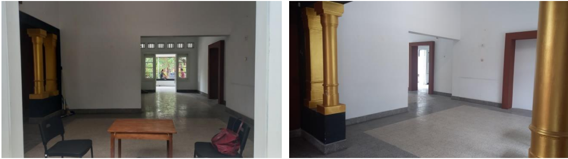
Gambar 2. Kondisi Eksisting Bangunan Bagian Dalam