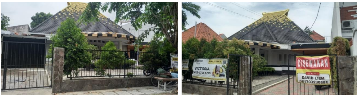
Gambar 1. Kondisi Eksisting Bangunan Bagian Luar

Saat ini, sebagian bangunan kolonial di sekitar Jalan Bawean masih difungsikan sebagai rumah tinggal, kantor, maupun usaha komersial seperti kafe dan studio kreatif. Namun, beberapa bangunan mengalami perubahan fasad dan renovasi yang cukup signifikan akibat tekanan perkembangan kota dan kebutuhan fungsional yang baru. Adapun bangunan yang akan diobservasi awalnya adalah rumah milik keluarga China Tionghoa yang sebagian anggota keluarganya sudah tidak berada di Surabaya, sehingga dalam perkembangannya bangunan tersebut disewakan untuk dijadikan bangunan komersial berupa kafe.